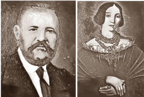
Gheorghe Eminovici (1812-1884) și Raluca Eminovici (1816-1876) Pictură în ulei de Anton Zigri